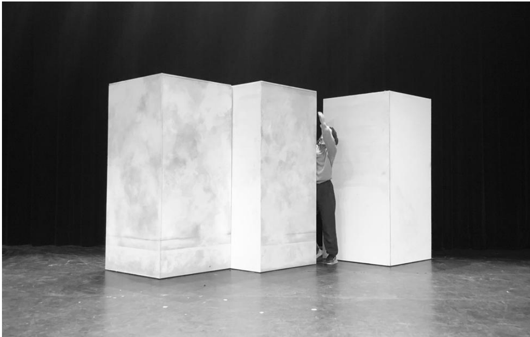
*Photo de répétition